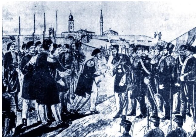
Турци предају кључеве Калемегдана кнезу Михаилу Обреновићу

Реорганизација војске и склапање савеза са другим земљама само је била припрема за одлучујући рат са Османским царством, али прије него што Србија у рат крене, морало је да се ријеша питање турских војних гарнизона у српским градовима. Године 1862. турски војници су код Чукур чесме у Београду убили српског дјечака, што је изазвало велике nerede у граду, а Турци су се повукли на Калемегданску тврђаву одакле су почели да бомбрдују Београд. Овај инцидент кнез Михаило је одлучио да искористи како би убиједио велике силе да је присуство турске војске у српским градовима главни извор нестабилности и инцидената. Дипломатска борба на крају се исплатила, тј. турски војници морали су да се повуку из Србије, а утврђења су предата српској војсци. Тим чином Османско царство је изгубило скоро сваки утицај у Србији.