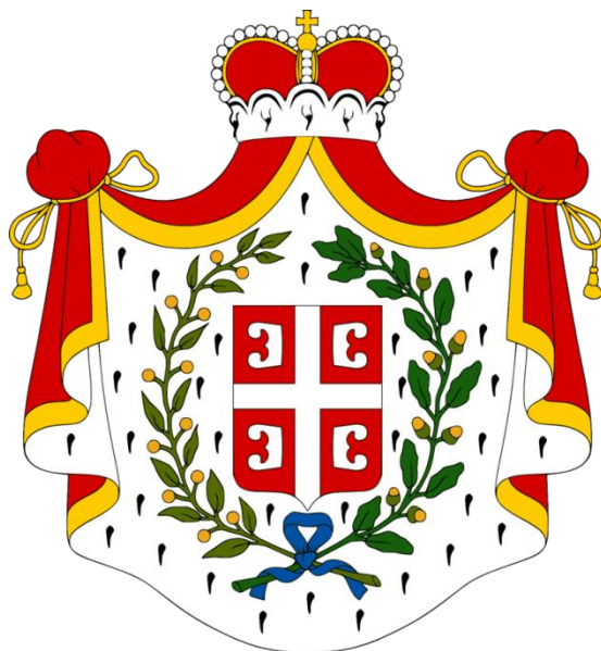
Грб Кнежевине Србије

Својом политиком и дипломатијом Милош Обреновић успио је да издејствује аутономију Србије у оквиру Османског царства и то је био први корак ка потпуном осамотањењу Србије. Укинута су турски феудални односи и створили су се услови за развитак грађанског друштва и буржоазије. У ослобођеној земљи сву власт у својим рукама имао је Милош Обреновић који је владао апсолутистички и такав облик власти није одговарао новонасталој српској буржоазији. Представници буржоазије тражили су начин којим би могли да ограниче апсолутизам кнеза Милоша, те су одлучили да напишу устав којим би се ограничила Милошева неограничена власт. Тако је 1835.г. установљен Сретенски устав, међутим он није ступио на снагу, јер су против њега биле велеке силе. Такву ситуацију одлучили су да искористе Турци, како би се умијешали у унутрашње приике у Србији, те су 1838. г. Србији прописали устав. Турским уставом владавина кнеза Милоша значајно је ограничена и пошто није хтио да влада на такав начин абдицирао је, а власт је препустио своме сину Михаилу Обреновићу (1839.- 1842.) Кнез Михаило такође није хтио да влада са ограничењима, те је иступао самовољно и због тога се против њега буни српска буржоазија, која га је збацила са власти 1842.г. Најистакнутији представници буржоазије били су Тома Вучић Перишић , Аврам Петронијевић и Илија Гарашанин . Они су названи уставобранитељи јер су бранили Турски устав који је ограничавао власт кнеза.